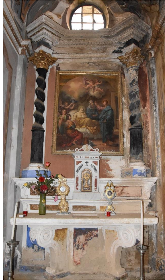
Autel de saint Joseph dans la paroisse San Cipriano de Morsiglia