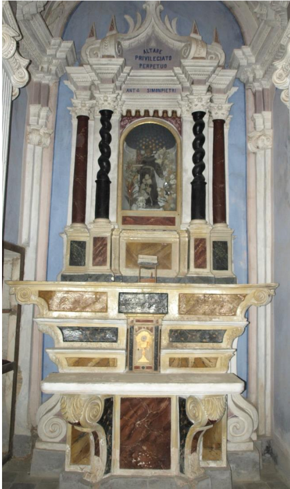
Autel de saint Antoine de Padoue dans la paroisse San Silvestro de Centuri (1820)