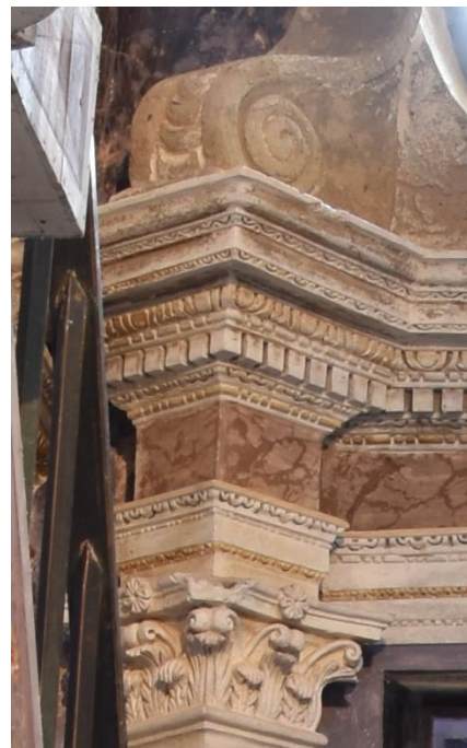
Autel de saint Jean-Baptiste (baptistère) dans la paroisse San Cipriano de Morsiglia